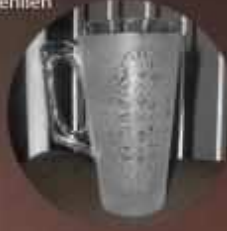
KUMLAMA CAM BARDAK