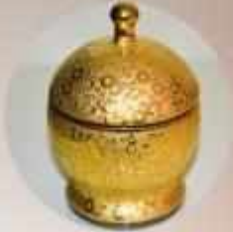
ALTIN YALDIZ CAM KASE