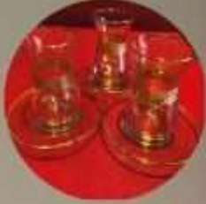
ALTIN YALDIZ CAM BARDAK

Cam obje süslemelerimizde 24 AYAR ALTIN YALDIZ ve YALDIZ BOYAMA kullanılarak tamamen EL İŞÇİLİĞİ ile objeye özgü istenilen desen ve logo uygulanabilmektedir.