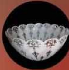
KUMLAMA CAM KASE