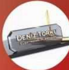
ALTIN YALDIZ & KUMLAMA CAM İSİMLİK

BAŞİSKELE HALK EĞİTİMİ MERKEZİ DÖNER SERMAYE İŞLETMESİ CAM SÜSLEME ATÖLYESİ