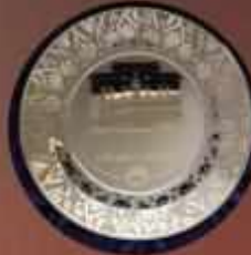
KUMLAMA CAM TABAK