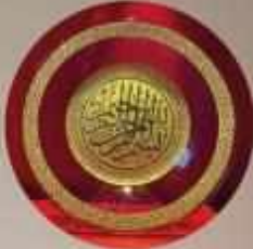
ALTIN YALDIZ CAM TABAK