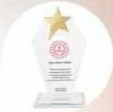
ALTIN YALDIZ & KUMLAMA CAM PLAKET